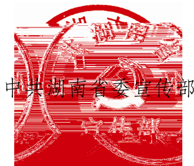
中共湖南省委宣传部