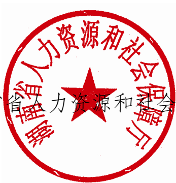
湖南省人力资源和社会保障厅