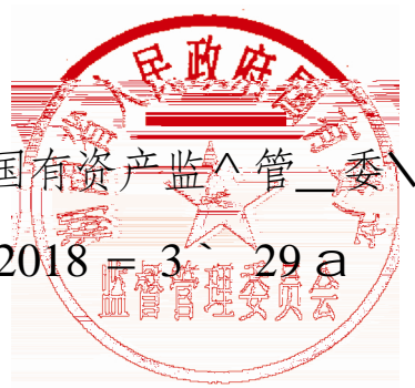
湖南省国有资产监督管理委员会